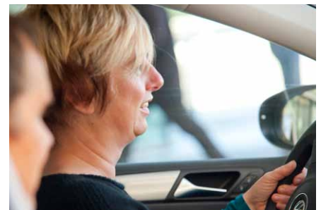
Die DUU Parken-App: Übersicht der Parkmöglichkeiten für Patienten, Besucher, Studenten und Mitarbeiter auf einen Blick