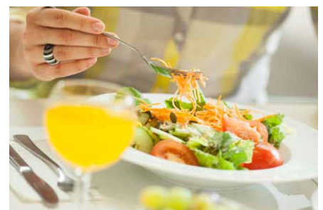
Das ist neu: Im Casino Oberer Eselsberg wurde das Speisenangebot durch ein Tagesessen als neue Verpflegungslinie erweitert