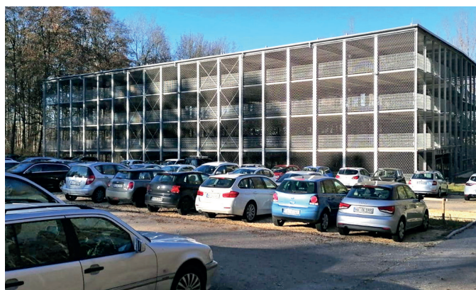
Das Parkhaus P23 wird von der DUU bewirtschaftet