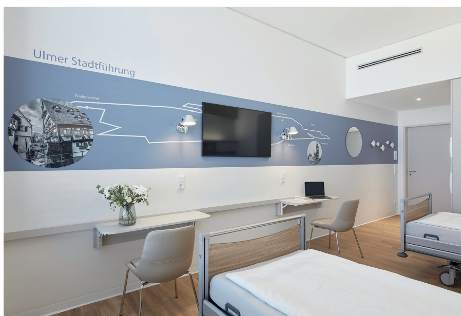
Die neue Wahlleistungsstation der Chirurgie