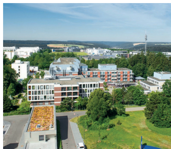
Blick auf das RKU

Damit können zusätzlich über 140 Mitarbeiterinnen und Mitarbeiter Teil der DUU werden. Sie sollen zukünftig die Serviceleistungen der Bereiche Speisenversorgung, Reinigung, Versorgungsassistenz, Information und Pforte am RKU übernehmen.